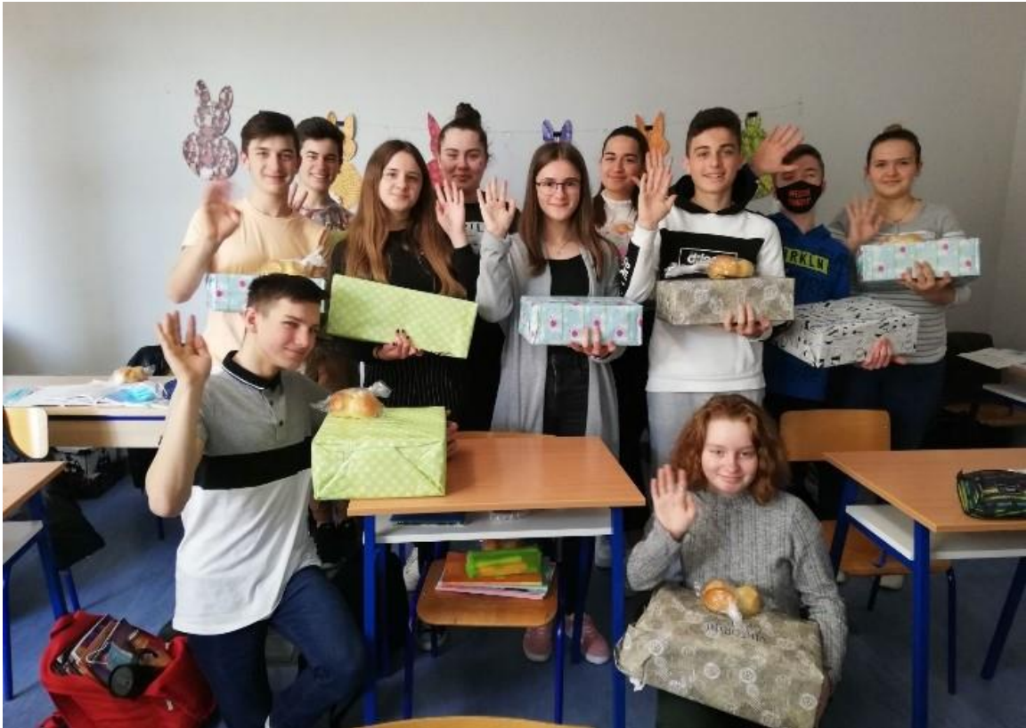
OŠ Ivan Goran Kovačić